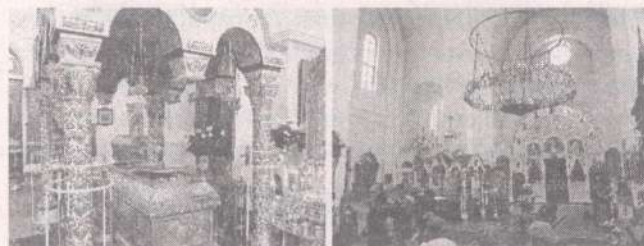
3. Рака с мощами преп. Евфросинии Полоцкой 4. В храме

собора в Полоцке. Разрешение на это ей дал сам полоцкий епископ Илия. Она переписывала, а, возможно, и переводила книги. Около 1124 года монахиня получила от епископа участок земли недалеко от Полоцка, там она решила построить