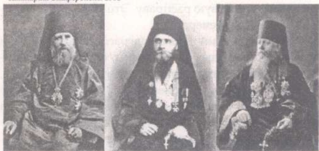
Архиепископ Тихон. Вильно. Март 1914. Архимандрит Лаврентий. Архиепископ Агафангел.

28 февраля 1912 года он был назначен ректором Литовской духовной семинарии и