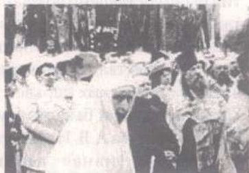
Великая княгиня Елизавета Федоровна. Вильно. 9 мая 1913