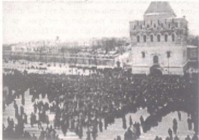
Молебен на Благовещенской площади. 2 февраля 1918

2 февраля 1918 года, в праздник Сретения Господня, в Нижнем Новгороде, в ответ на Патриаршее послание «об анафематствовании творящих беззакония и гонителей веры и Церкви Православной», состоялся величественный крестный ход. Жители города и его окрестностей решили так выразить свою преданность Русской Православной Церкви. В этот день, утром, Спасо-Преображенский кафедральный собор, где Преосвященный Лаврентий начал служить Божественную литургию, был переполнен молящимся народом. В конце литургии было прочитано воззвание Всероссийского Священного Собора к православному народу, принятое после Декрета большевиков о свободе совести. Владыка же произнес слово о мирной христианской борьбе с врагами веры и Церкви. Затем начато было служение молебна об умирении страстей.