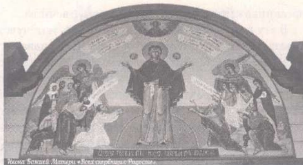
Икона Божией Матери «Всех скорбящих Радосте»