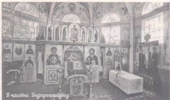
В часовне. Внутренний вид