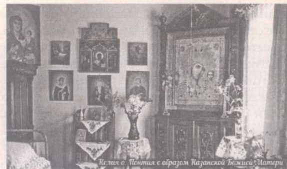
Икона с Понтием с образом Казанской Божией Матери

сеют и поддерживают межнациональную вражду. Господь предупреждает человечество и «Звездой Польнейю» Чернобыля и Фукусимой, всеми техногенными и природными катастрофами, пожарами, наводнениями, колебаниями климата и космическими событиями, такими, как Тунгусский и Челябинский метеориты. Господь зовет: «Покайтесь! Вы ходите по острию ножа над пропастью, воюя любыми способами и средствами за комфорт одних людей, элит, стран, союзов за счет других!» Стоит Господу попустить изменение орбиты какой-либо кометы или метеорита на доли угловой секунды, или изменение глобальной температуры на пару градусов; или попустить людям изуродовать природу – Землю ждет катастрофа, в которой погибнут миллиарды людей, а остальные, как звери, перегрызут друг друга глотки в борьбе за выживание. Вновь и вновь, демонстрируя нам то, что человеческие возможности не столь велики, как полагают правящие миром элиты. Господь призывает нас всех к покаянию во имя спасения. Призывает жить по Евангелию, соборно, всем человечеством и спастись. Михново – важный пример одного из путей к спасению. Отголоски греховных веяний века просачиваются и сюда. Однако здесь люди борются с ними и имеют сильную духовную поддержку в этой борьбе со своими грехами. Чудо того, что Михновская община выстояла столетие, прошла через все гонения и испытания, даже через временную потерю духовных пастырей не просто свидетельствует, а доказывает присутствие Святого Духа и его руководство жизнью общины.