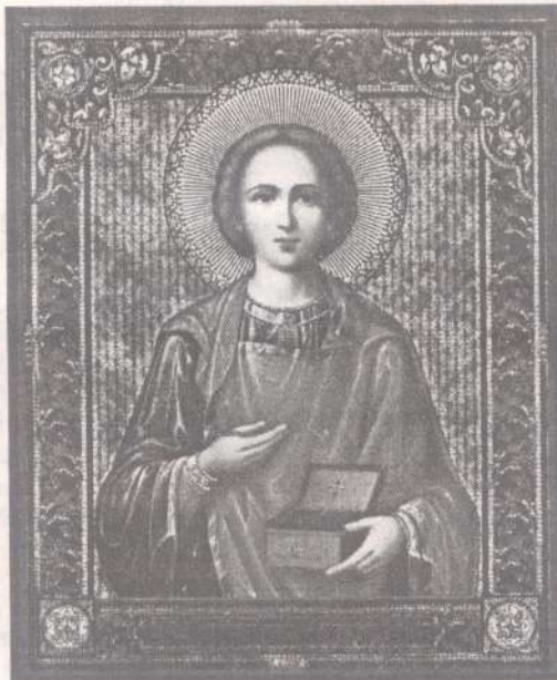
Св. великомученик и Целитель Пантелеимон

12-летие освящения престола нижнего храма в честь великого воина Царя Небесного и всемилостивого (как указывает само его имя) врача телесных и душевных скорбей братьев и сестер своих во Христе и всякого прибегающего к нему с молитвой и упованием, ознаменовалось для нас важнейшим событием - официальной сдачей в эксплуатацию всего здания храма. Таким образом, подводится некая черта под почти двадцатилетними усилиями по созиданию еще одного дома Божия в Висагине. То, что это событие, как и прием 12 лет назад нижнего храма, Господь приурочил к празднику Св. Пантелеимона, свидетельствует («читающий да понимает», Мф. 24, 15), что святой великомученик является не