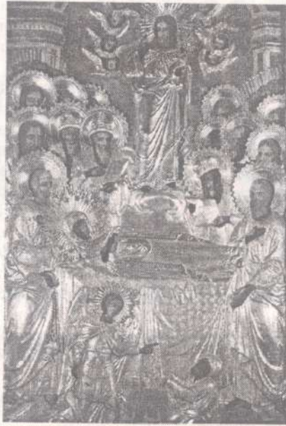
Икона Успения Пресвятой Богородицы

телесном вознесении на Небо. Вечером того же дня собравшимся на ужин апостолам явилась Сама Матерь Божия и сказала: «Радуйтесь! Я с вами - во все дни».