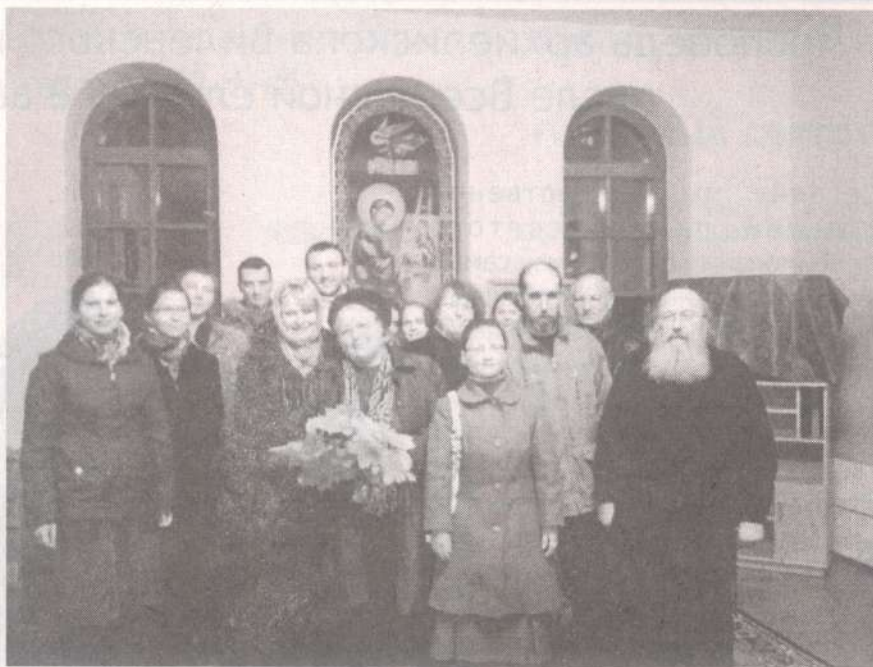
Кандидаты на членство в висагинский филиал Православного Братства

В статье использована информация сайта http://ru.wikipedia.org