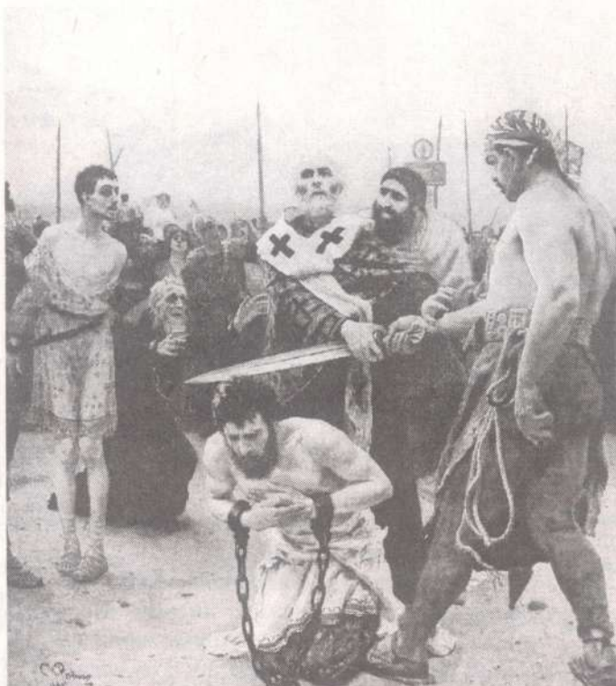
Илья Репин "Николай Мирликийский избавляет от смертной казни трех невинно осужденных"

Этот случай описан у С. Нилуса в одной из его книг. Речь там шла о воре, который имел суеверную любовь к Угоднику, и всякий раз, идя на воровство, ставил святому свечку. Не смеялись над этим вором, братья. Это только со стороны кажется, что глупость очевидна. При взгляде изнутри зоркость теряется, и мы сами часто творим неизвестно что, не замечая нелепости своих поступков. Так вот, вор ставил святому свечи и просил помощи в воровстве. Долго всё сходило ему с рук, и эту удачу он приписывал помощи Николая. Как вдруг однажды этот по особенному «набожный» вор был замечен людьми во время воровства. У простых людей разговоры недолгие. Грешника, пойманного на грехе, бьют, а то и убивают. Мужики погнались за несчастным. Смерть приблизилась к нему и стала дышать в затылок. Убегая от преследователей, он увидел за селом павшую лошадь. Труп давно лежал на земле, из лопнувшего брюха тек гной, черви ползали по телу животного, и воздух вокруг был отравлен запахом гнили. Но смертный страх сильнее любой брезгливости. Вор забрался в гниющее чрево и там, среди смрадных внутренностей, затаился. Преследователям даже в голову не могло прийти, что убегавший способен спрятаться в трупе. Походив вокруг и поругавшись всласть, они ушли домой. А наш «джентльмен удачи», погибая от смрада, разрывался между страхом возмездия и желанием вдохнуть свежего воздуха.