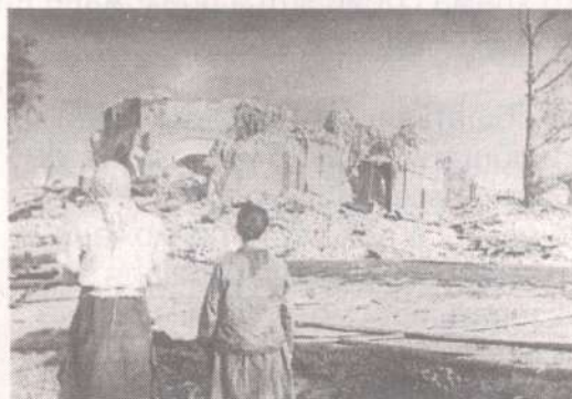
Жительницы деревни Короськово у развалин церкви, взорванной немецкими войсками при отступлении. Дата съемки: 1943 Место съемки: Россия, Орловская обл. д. Короськово