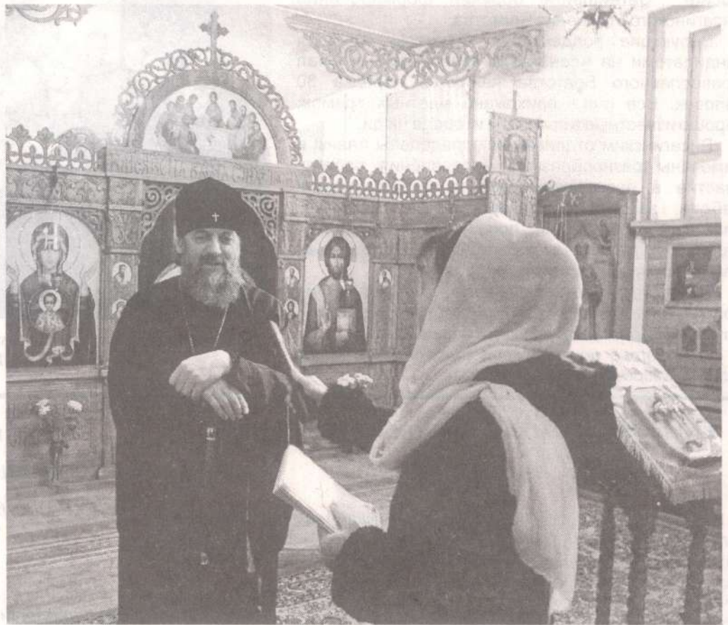
Архиепископ Виленский и Литовский Иннокентий в нашем храме

И когда пришел час пострадать за Христа, он это сделал, ни минуты не колеблясь. Терпел страшные мучения, и все ради любви к Богу. И страдание его имело громаднейший резонанс в то время, в том обществе, как и страдание другого великомученика Георгия. Они оба были очень известными людьми. Георгий был военным, Пантелеимон - искусным врачом, очень молодым талантливым, ибо имел особый благодатный дар от Бога. Он делал все ради Господа, ради любви к ближним своим. Поэтому Господь неисповедимым промыслом пресек его молодую жизнь и попустил ему