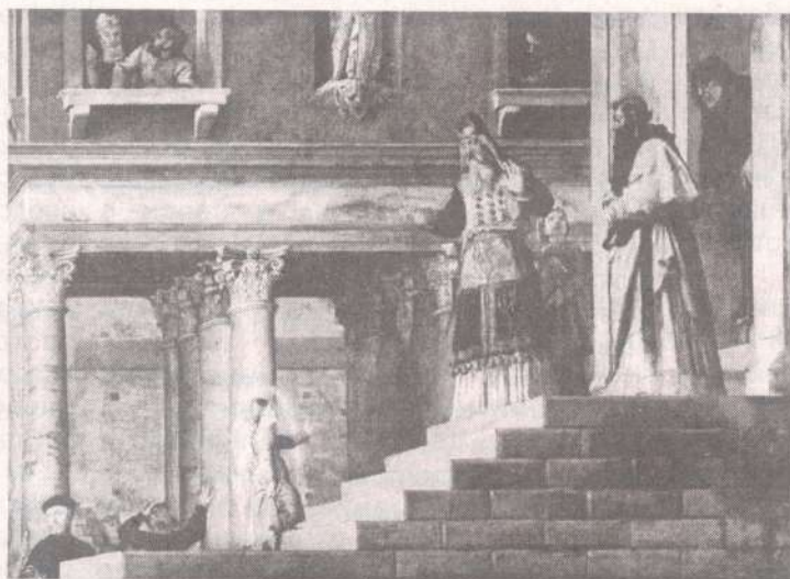
Введение во храм Пресвятой Богородицы (Тициан, 1534—1538)

В храм вела лестница в пятнадцать высоких ступеней. Младенец Мария, как только Ее поставили на первую ступень, укрепляемая силой Божией, быстро преодолела остальные ступени и взшла на верхнюю. Затем первосвященник Захария, по внушению свыше,