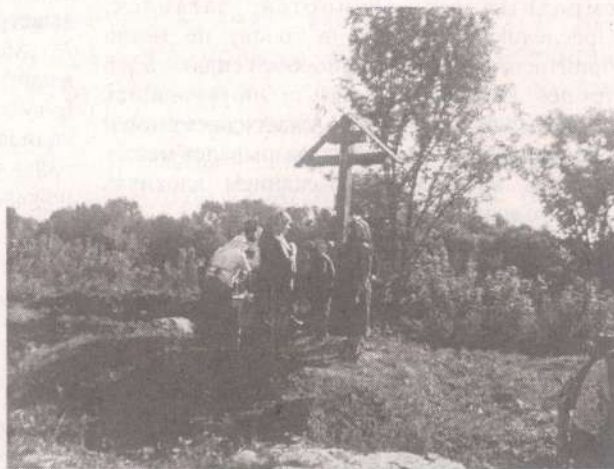
Освящение Креста на месте взорванной церкви святых Космы и Дамиана. с. Короськово