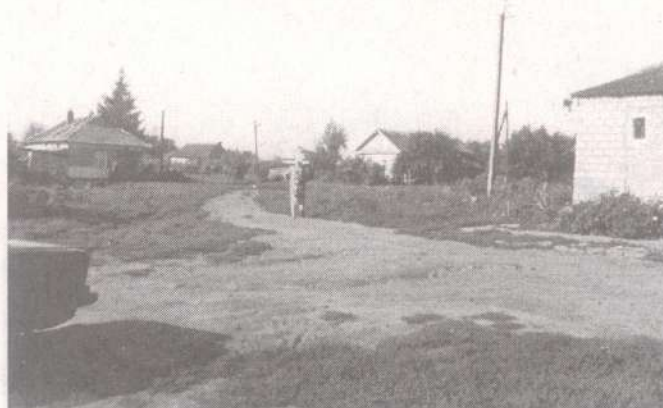
Село Короськово. Лето 2011 г.

Скорбящих Радости в селе Михново, архимандрит Леонид сказал: "Святые живут рядом с нами".