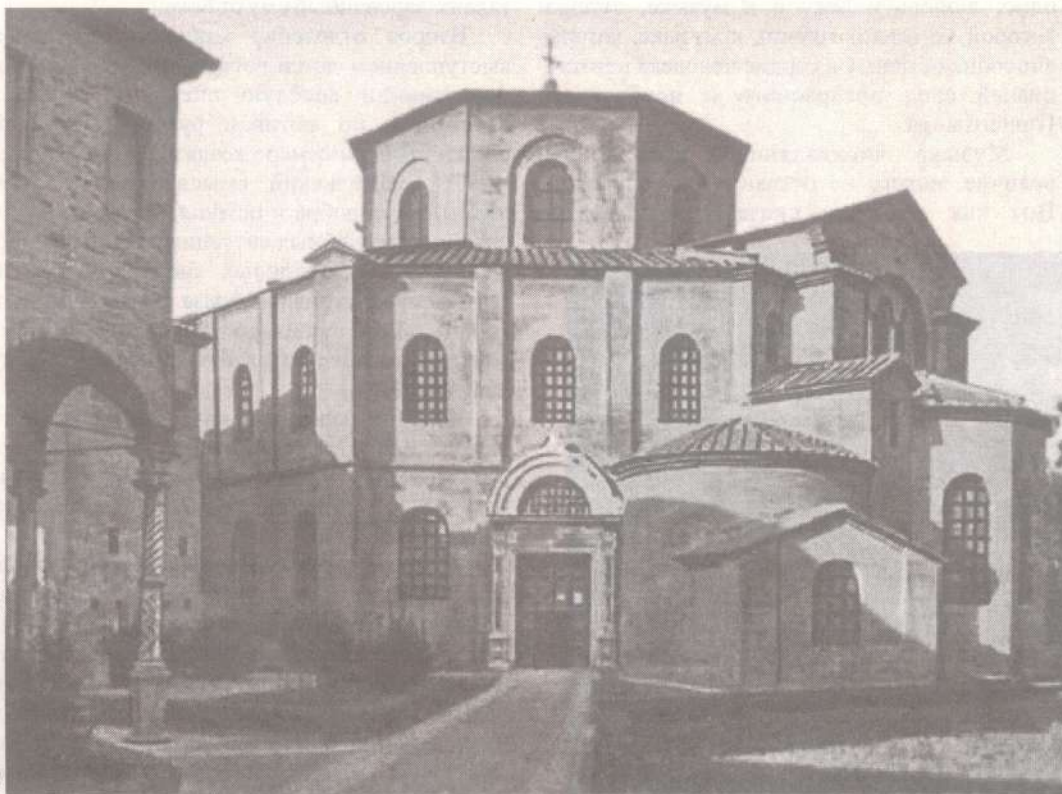
Византия. Базилика св. Иоанна Студита в Константинополе. 5 в.

Мощный стимул к раскрытию разнообразных дарований грузинского народа исходил из двух источников христианской религии и византийской цивилизации. Христианская религия пробуждала духовную потенцию, жажду творчества, духовно переплавляла грузин, а византийская цивилизация предоставляла готовые формы, в которые мог отливаться этот новый сплав христианской духовности и национальной самобытности. Грузины внесли много своего в национальный облик христианства, они были более тверды и устойчивы в православии и верности церковному единству, чем другие восточные народы, лучше сохранили дух вселенскости и терпимости, они строили своеобразные храмы, писали оригинальные жития, создали такое неповторимое произведение духовной литературы, как повесть о Варлааме и Иоасафе, наконец, своеобразие грузинского народного гения выразилось в таком удивительном творении, как «Витязь в тигровой шкуре», но сами идеи и образцы христианской жизни и христианского творчества были получены ими от Византии и в Византии.