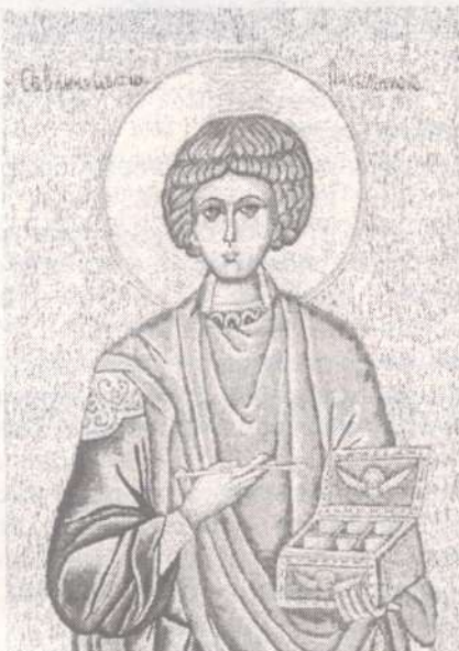
Храмовая икона св. Пантелеимона

В то время в Никомидии скрывались пресвитеры Ермолай, Ермипп и Ермократ, уцелевшие после сожжения христиан в городском храме. Иерей Ермолай обратил внимание на юного врача и изложил ему основные истины христианской веры. Панталеон стал посещать пресвитера и получил от Бога дар исцелять болезни призыванием имени Христа. Увидев однажды на улице мертвого ребенка, укушенного змеей, Панталеон стал просить Господа о воскрешении умершего. Ребенок ожил. После этого чуда Панталеон принял крещение и был переименован в