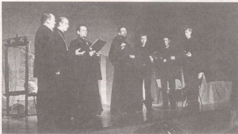
Мужской православный хор «Скитос» г. Вильнюс