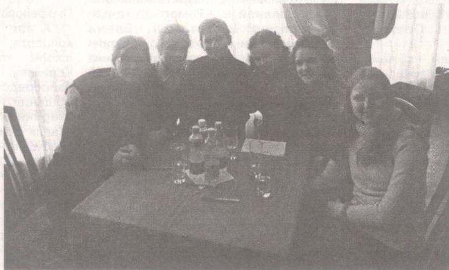
Команда «Патмос» (г. Висагинас)