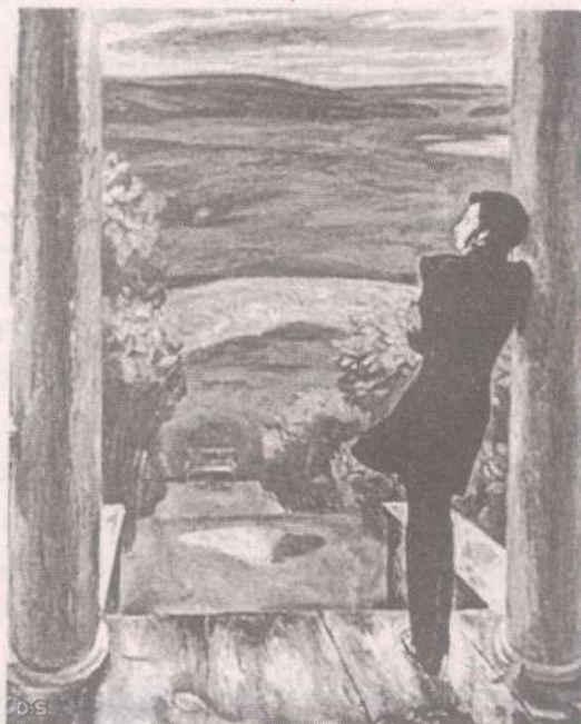
Последняя осень в Михайловском.