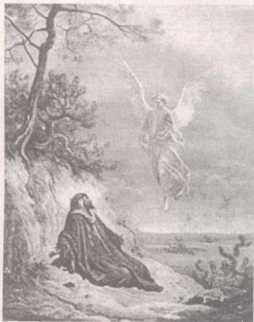
Ангел приносит пищу пророку Илии. Иллюстрация Доре

Основываясь на общих понятиях, надобно согласиться противоречащих выражений о Боге не понимать буквально. Так, например, по общепринятому разумению, должно признать, что Божие естество благо, не причастно гневу и правосудно. Посему если Писание говорит, что Бог гневается, или скорбит, или раскаивается, или дает кому ответ не по достоинству, то надлежит вникнуть в Цель изречения и внимательно подумать, как может быть восстановлен истинный смысл, а не извращать достойных уважения мыслей о Боге. Таким образом, не будем встречать преткновений в Писании, извлекая для себя пользу из мест удобопонятных и не терпя вреда от мест неясных.