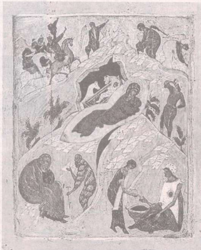
"Рождество Христово" Икона начала XVI века.

Свет истины — это Божественный свет, это Божественная правда. Она неизменна и вечна и не зависит от того, принимаем мы ее или нет. Принятие человеком Божией правды определяет, в первую очередь, характер его отношений с другими людьми, способность, по слову апостола, носить «тяготы друг друга» (Гал. 6:2), то есть проявлять солидарность с ближними, соучаствуя и в радости, и в горе другого человека. «По тому узнают все, что вы Мои ученики, если