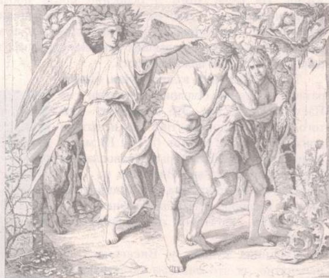
Юлиус Шнорр фон Карольсфельд "Изгнание из рая"

На дне всякого кубка земных наслаждений таится скорпион. Да и кубки эти так неглубоки, что скорпион всегда близ наших губ.