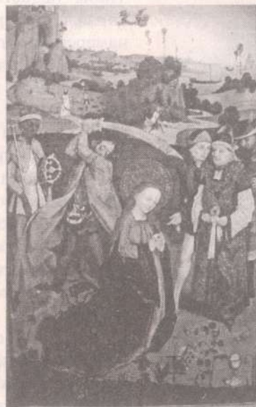
Казнь св. Варвары

Говоря о жестокой каре, обрушившейся на мучителей святой Варвары, Предстоятель призвал помнить, что жизнь по языческому закону плоти не может принести человеку ни радости, ни счастья, ни благополучия, но лишь навлекает на него гнев Божий. «Будем молиться святой мученице Варваре о том, чтобы по ее святым молитвам преодолевалось разделение среди народа нашего, чтобы по ее святым молитвам дух языческого идолопоклонства, жестокости и ненависти уходил из жизни нашего народа», заключил Святейший Патриарх Московский и всея Руси Кирилл.