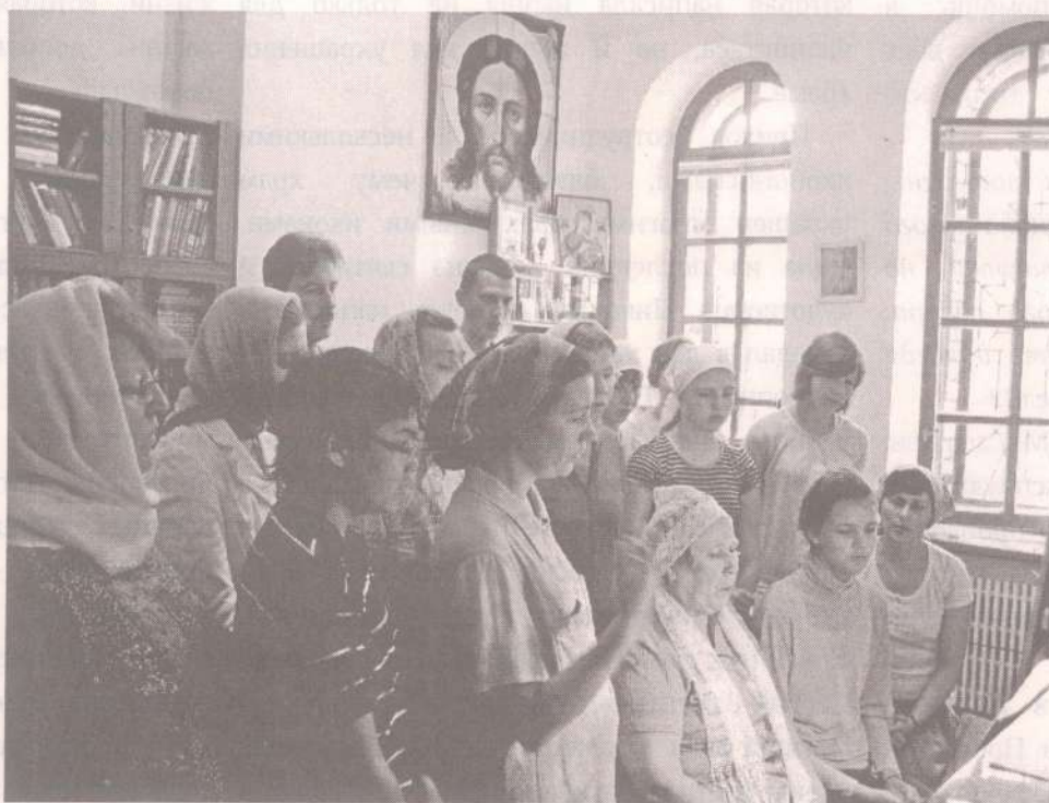
Репетиция церковного хора перед воскресной службой