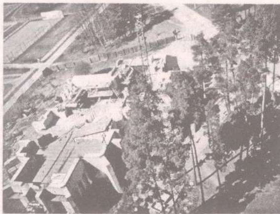
Строительная площадка. Вид сверху.