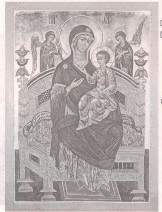
Икона Божией Матери "Всецарица"

О Пречистая Богомати, Всецарице! Услыши многоболезненное воздыхание наше пред чудотворною иконою Твоею, из удела Афонского в страну нашу пренесенною, призри на чад Твоих, неисцельными недуги страждущих, ко святому образу Твоему с верою припадающих! Якоже птица крилома покрывает птенцы своя, тако и Ты ныне, присно жива сущи, покрый нас