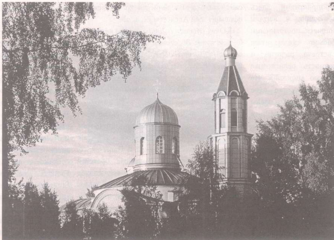
Висагинская церковь Введения во Храм Пресвятой Богородицы

- Что там будет? ...Когда мы войдем в придел, нас встретят голые стены, как было и в Пантелеимоновском приделе. Правда, там ко времени освящения были сооружены престол и иконостас. Престол постараемся сделать, а вот иконостас будем возводить позднее.