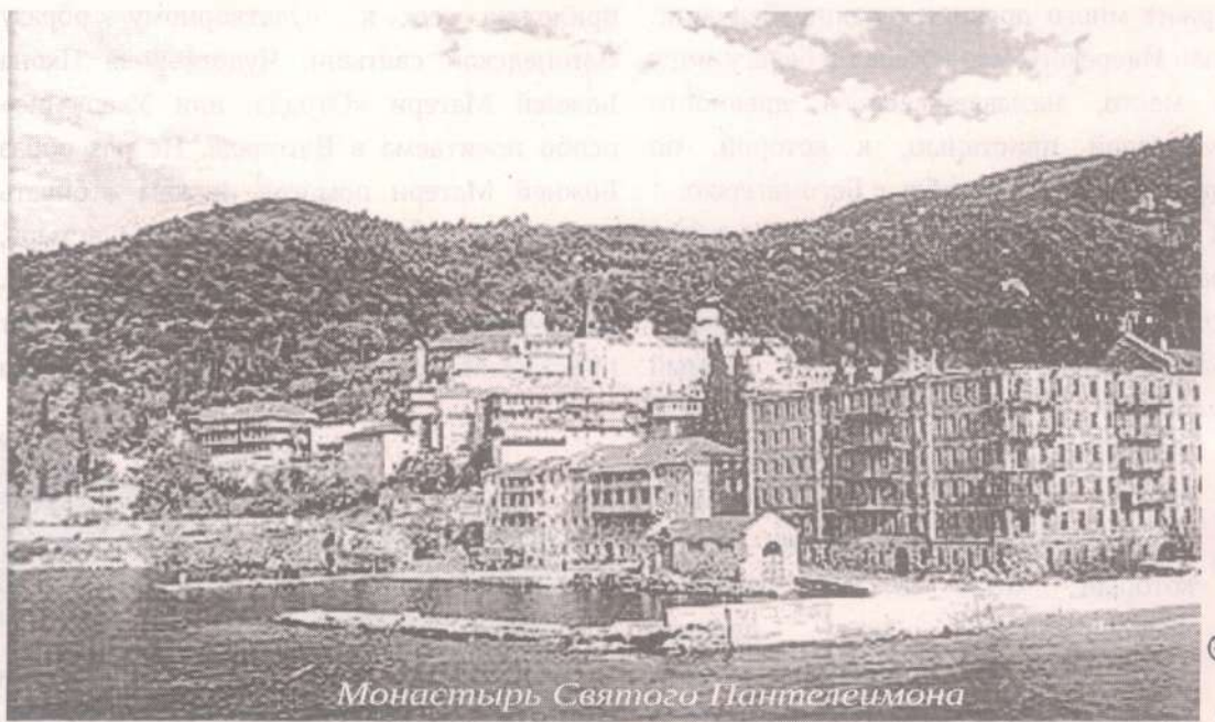
Монастырь Святого Пантелеимона

многоцелебным Твоим омофором. Тамо, идеже надежда исчезает, несумненной Надеждою буди. Тамо, идеже лютыя скорби превозмогают, Терпением и Ослабою явися. Тамо, идеже мрак отчаяния в души вселися, да возсияет неизреченный свет Божества! Малодушныя утеши, немощныя укрепи, ожесточенным сердцам умягчение и просвещение даруй. Исцели болящия люди Твоя, о всемилостивая Царице! Ум и руки врачующих нас благослови; да послужат орудием Всемощного Врача Христа Спаса нашего. Яко живей Ти сущей с нами молимся пред иконою Твоею, о Владычице! Простри руце Твои, исполненные исцеления и врачбы, Радосте скорбящих, в печалех Утешение, да чудотворную помощь скоро получив, прославляем Живоначальную и Нераздельную Троицу, Отца и Сына и Святаго Духа во веки веков. Аминь.