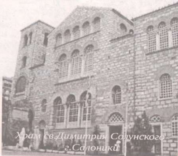
Храм св.Димитрия Солунского г.Салоники

В этом монастыре в церковной лавке отец Иосиф приобрел для нашего храма икону Божией Матери «Отрада, или Утешение» и приложил ее к чудотворному образу Ватопедской святыни. Чудотворная Икона Божией Матери «Отрада, или Утешение» особо почитаема в Ватопеде. Не раз образ Божией Матери помогал инокам отбивать нападения разбойников на монастырь, заранее оповещал их о грозящей опасности. На иконе Богородица, уклоняется от простертой десницы Богомладенца, чтобы