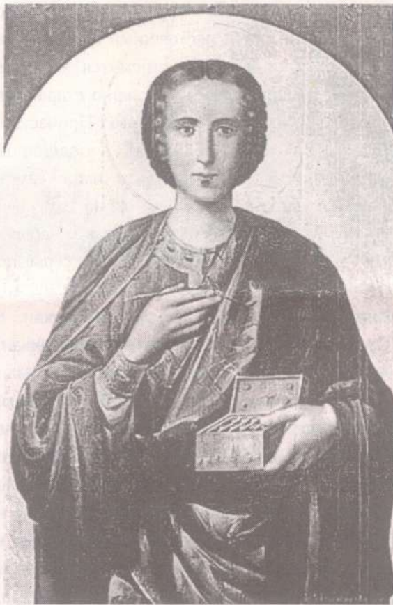
Св. великомученик Пантелеимон

Святой Пантелеимон жил в III-IV веках в городе Никомидия (Малая Азия). Родители назвали мальчика Панталеон, что значит «как лев» (лишь позже, при крещении, отрок был назван Пантелеимоном, что значит «всемиловитый», за его милосердие, щедрость, милость). Однажды, возвращаясь от учителя, юноша увидел лежавшего на дороге мертвого ребенка, укушенного ехидной. Исполнившись сострадания и жалости, Пантелеон стал просить Господа о воскрешении умершего и умерщвлении ядовитого гада. По действию Божественной благодати ребенок ожил. Приняв при крещении имя Пантелеимон, он всю свою жизнь посвятил служению больным, убогим и нищим. Пантелеимон посещал тюрьмы и лечил узников. Во время очередного гонения на христиан, целитель по доносу был арестован и предан мучениям. Самые жестокие пытки не приносили мученику никакого вреда. Дикие звери, на растерзание которым бросили Пантелеимона, лизали ему ноги. Когда мученику отсекали голову, то из раны вместе с кровью истекло молоко. Когда