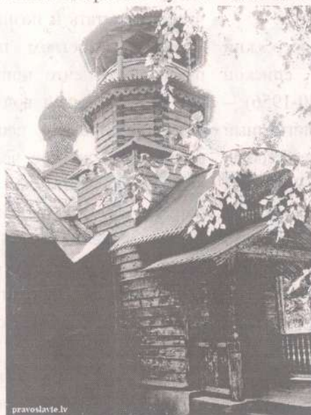
Храм св. преп.Евфросинии