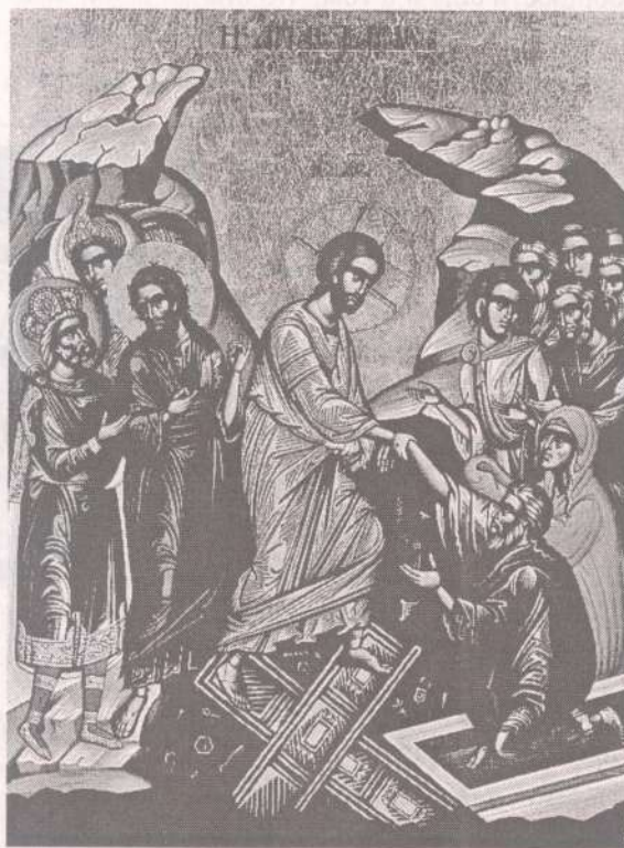
Воскресение Христово. Греческая икона.

В этот день (первый день недели по еврейскому счёту), как только кончился субботний покой, весьма