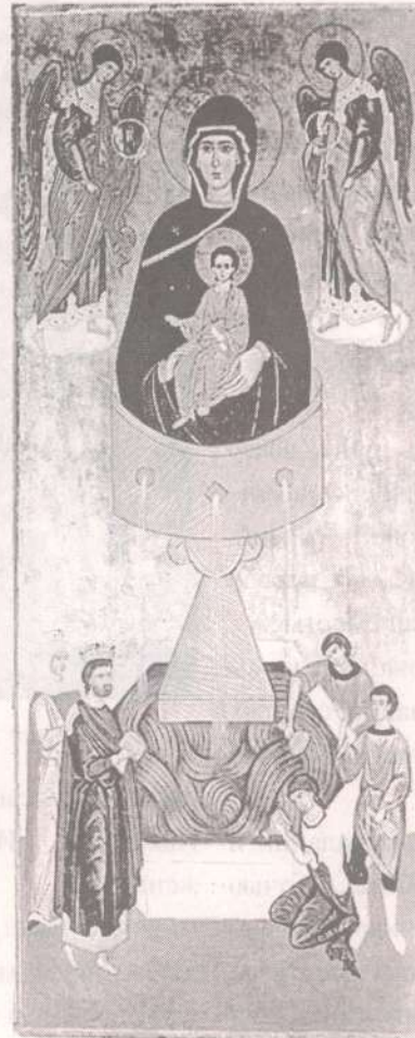
Икона Божией Матери "Живоносный источник"

В XV столетии известный храм «Живоносного источника» был разрушен мусульманами. К развалинам храма приставили стражника-турка, который не позволял подходить к этому месту.