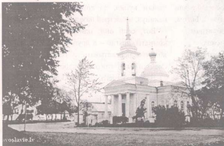
Лудзенский Свято-Успенский храм

православных приходов Латгалии, которые со дня своего освящения никогда не закрывались. Первый храм, который посетила группа паломников – собор Рождества Пресвятой Богородицы в городе Резекне – был возведен в 1846 году по проекту Петербургских архитекторов Давида Висконти и Шарлемана Бодэ II и освящен 25 июня того же года. До возведения собора молитвенный дом размещался на втором этаже каменного дома. Собор в Резекне всегда был центром, откуда шло распространение православия по городу и уезду. Со второй половины XIX века в г. Резекне велась усиленная просветительская деятельность среди старообрядцев и униатов: устраивались собеседования со староверами, велись богословские чтения, совершались службы на латышском языке. В целях распространения православной литературы, икон, крестиков при соборе существовала особая книжная лавка. В 1867 г. при соборе была воздвигнута каменная часовня в память спасения 4 апреля 1866 г. от руки убийцы императора Александра II.