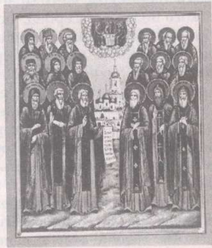
Икона Собор Семипалатинских святых

2000 г. 27 декабря преподобномученик иеромонах Митрофан (Кванин) канонизирован Архиерейским Собором Русской Православной Церкви по представлению Алма-Атинской епархии, входит в Собор Новомучеников и исповедников в Земле Казахской просиявших, Собор Семипалатинских святых.