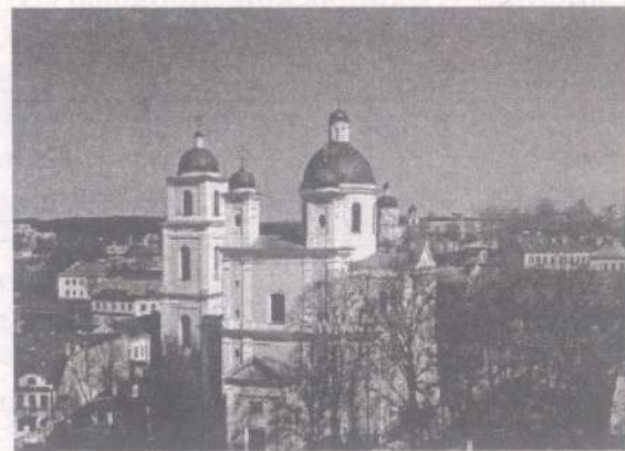
Свято-Духов монастырь, г. Вильнюс

Его память по новому стилю отмечается 17 декабря (4 декабря ст. ст.)