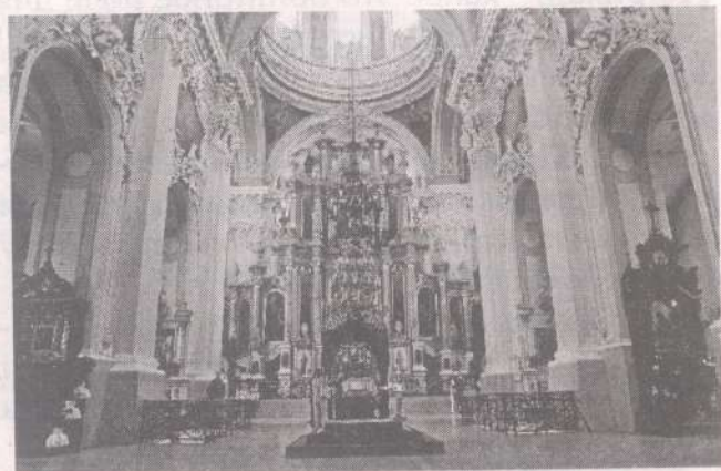
Свято-Духов монастырь, г. Вильнюс