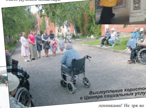
Выступление хоров в Центре социальных услуг