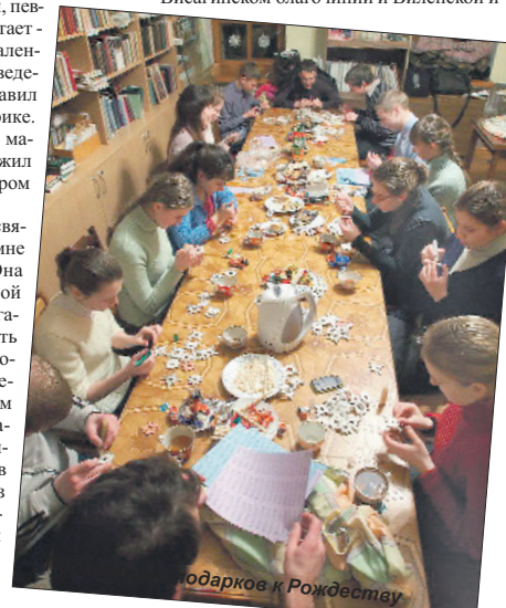
Подарков к Рождеству