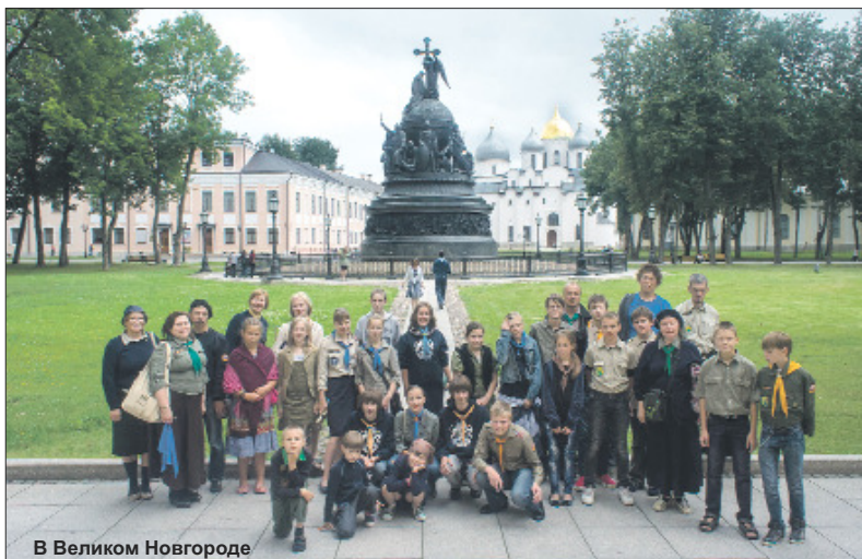
В Великом Новгороде

«Помоги собраться в школу» - одна из благотворительных акций, которую скауты нашего города провели для детей из малообеспеченных семей.