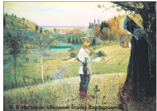
М. В. Нестеров. «Видение отроку Варфоломею»

Запечатлённое на картине М. Нестерова «Видение отроку Варфоломею» событие обрело поэтическую образность и необычайную масштабность: не несчастный мальчуган с задержкой умственного развития просит помощи у безвестного монаха, а сама Русь, ещё не понимающая в полной мере своего предназначения, но предчувствующая его, молит Всевышнего о ниспослании вразумления и духовной силы.