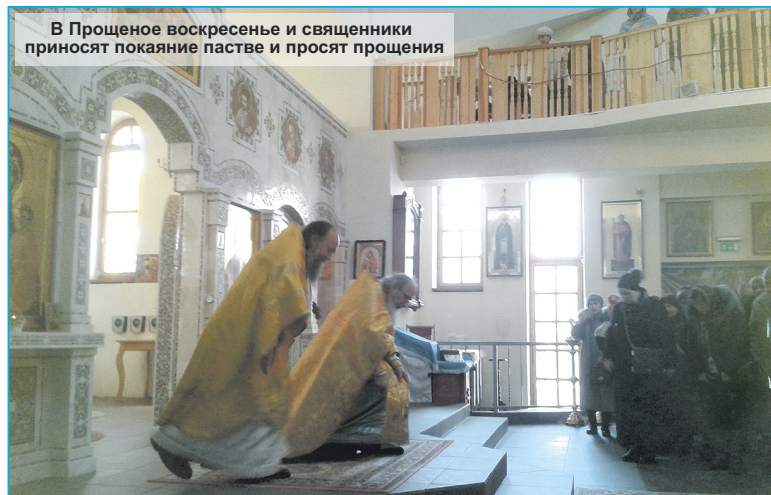
В Прощеное воскресенье и священники просят покаяние пастве и просят прощения

Не смотри на чужие грехи, а смотри на свои злые дела; ибо не за первые будешь судим, но за себя непременно дашь ответа.